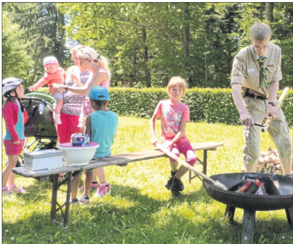
WANDERERLEBNISSE auch für die Kleinen wurden in Neusatz und Rotensol geboten, etwa beim Stockbrot-Grillen der Pfadfinder.

„Es hat die Vereine näher zusammengebracht“