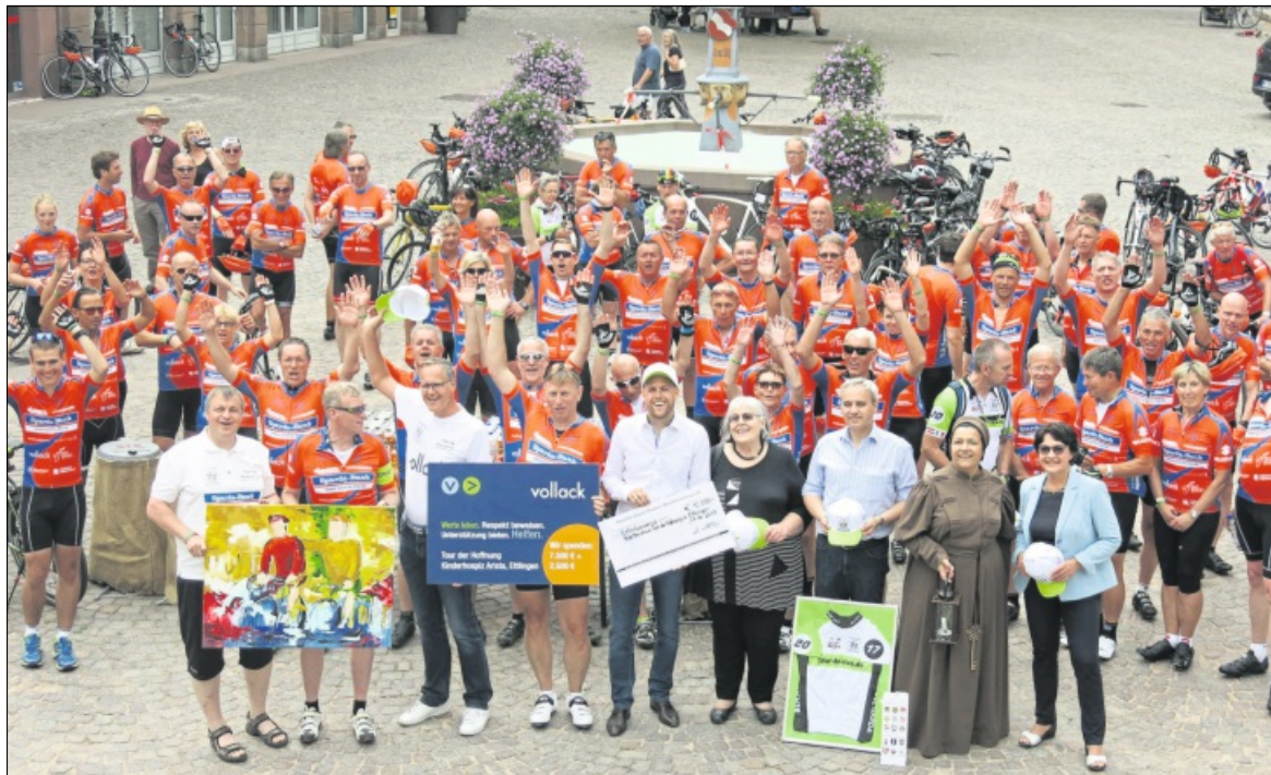
SPENDEN „ERSTRAMPELT“: Station machte die „Tour der Hoffnung“ auf dem Ettlinger Marktplatz, wo dann auch ein dicker Spendenscheck zugunsten des Ettlinger Hospizes übergeben wurde.

Enden wird die Tour am Samstag im italienischen Riva del Garda, eine der Partnerstädte von Bensheim, wo die Big Band ein großes Anknüpfungskonzert geben wird. Dann haben die Benefizradler nicht nur 777 Kilometer in den Beinen, sondern hoffentlich auch das erklärte Ziel von über 210 000 Euro an Spendengeld eingefahren.